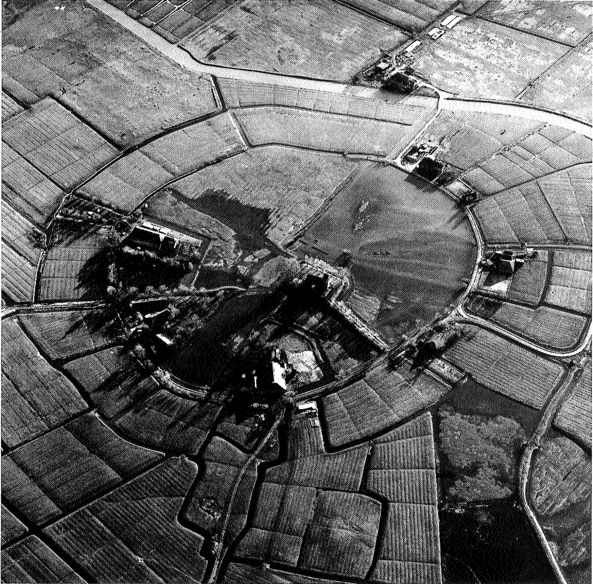
Luchtfoto terpdorpje Marum