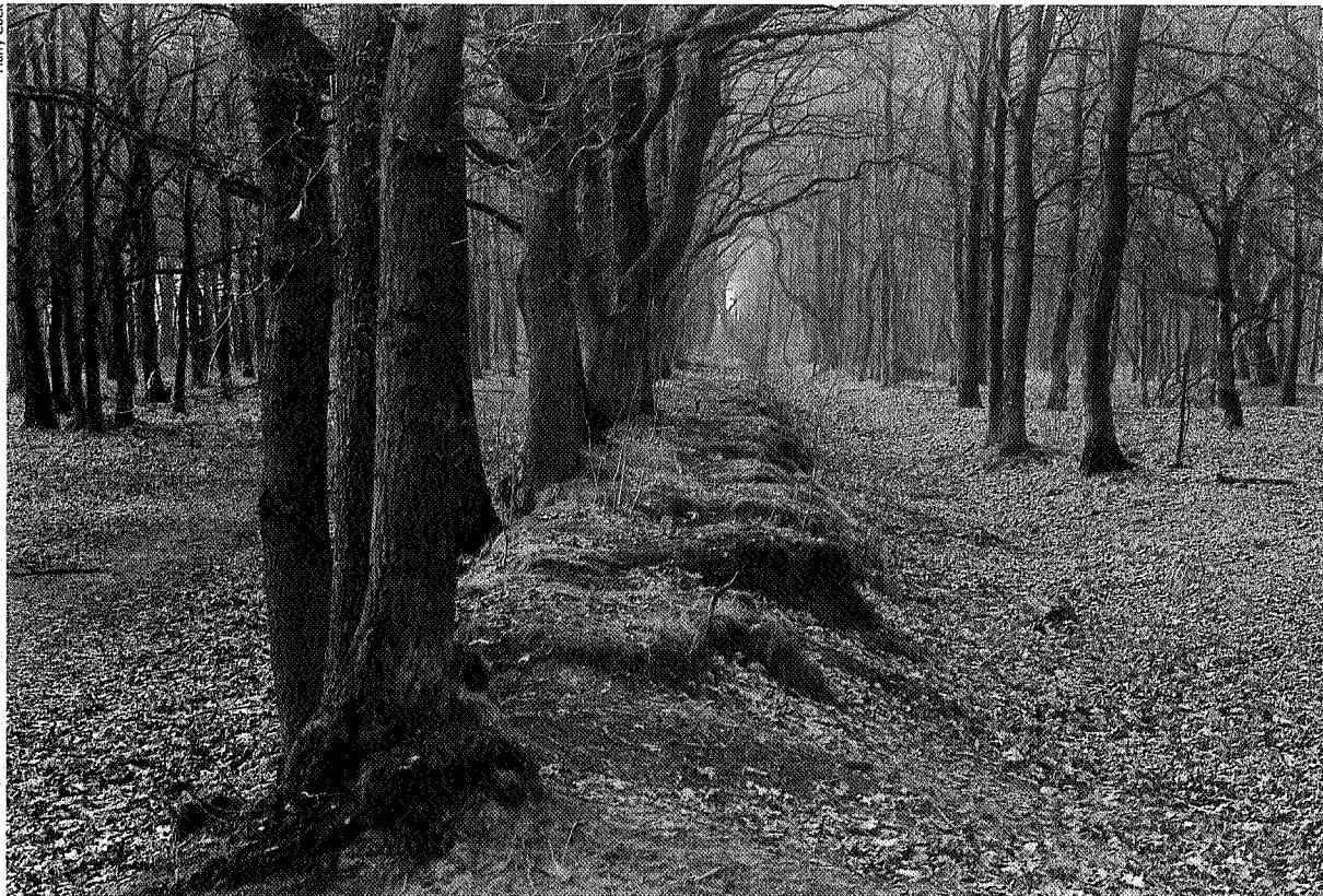
Aan de buitenzijde met eikentelgen beplante wal (ca. 1900). Oorspronkelijk gelegen in de heide en bedoeld om aan te leggen bos tegen schapen te beschermen. Aan beide zijden recente jonge opslag.

zaak was. Vooral langs de schapendriften, die van het dorp langs of door de es naar de heide leidden was het gevaar groot dat schapen ('snoeiërs') probeerden om de akkers te bereiken en zich te goed te doen aan het jonge gewas. Daar waren daarom vaak hoge wallen aangelegd die met struiken werden volgepoot. Beboste wallen met sloten aan beide zijden vond men ook overal langs de groenlanden, die sinds de 17e eeuw in de beekdalen en op vochthoudende hoge gronden waren aangelegd. Ook de bouwkampen waren vaak met houtwallen omgeven.