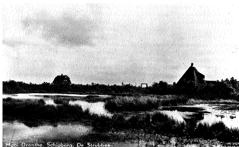
Moor Drenthe, Schipborg, De Strubben Ansichtkaart ca. 1940. Uitgeveende plas met zomerhuisjes in de toen nog zeer lage strubben van Schipborg.

Kleinere essen met goed ontwikkelde strubbenzones vinden we bijvoorbeeld in Vries (de Holtes) en