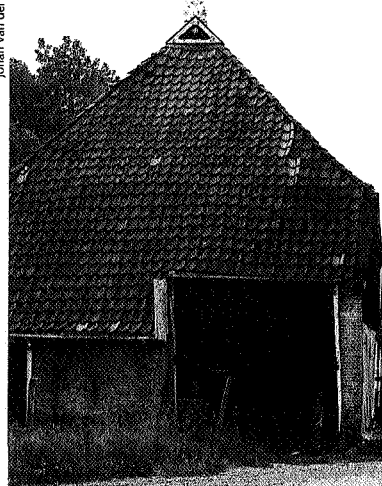
Dijkhuys op de Slachte bij Kiesterzijl