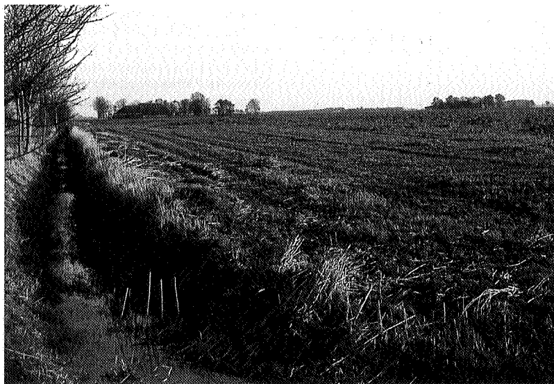
Het gebied langs de Oosterweg waar het ULV-terrein gepland was

een ULV-vliegveld aan de Oosterweg. Ze kwamen tot de konklusie dat er waarschijnlijk nergens in dit dichtbevolkte land nog een plek te vinden is waar men geen hinder ondervindt van het vliegen met ULV's. De wijze waarop een ULV-terrein toegewezen kan worden, is zeer ondemokratisch. Er bestaat geen goede inspraakmogelijkheid, alleen een AROB-procedure achteraf. De stand van zaken is nu als volgt: