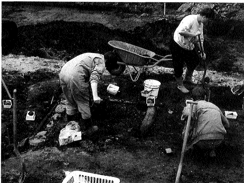
P. Broekhuizen/Monument & Materiaal

Als stadsarcheoloog is Kortekaas prettig veroordeeld tot de Stichting Monument & Materiaal, want samen kan de klus het beste geklaard worden. De gemeente heeft de opgravingsbevoegdheid. Het verwerken van het vondstmateriaal en het publiceren behoort tot de taken van de Stichting. Eén van de resultaten daarvan is de publikatie in 1993 van het boek 'Van boerenerf tot bibliotheek' een historisch, bouwhistorisch en archeologisch onderzoek van het voormalig Wolters-Noordhoff