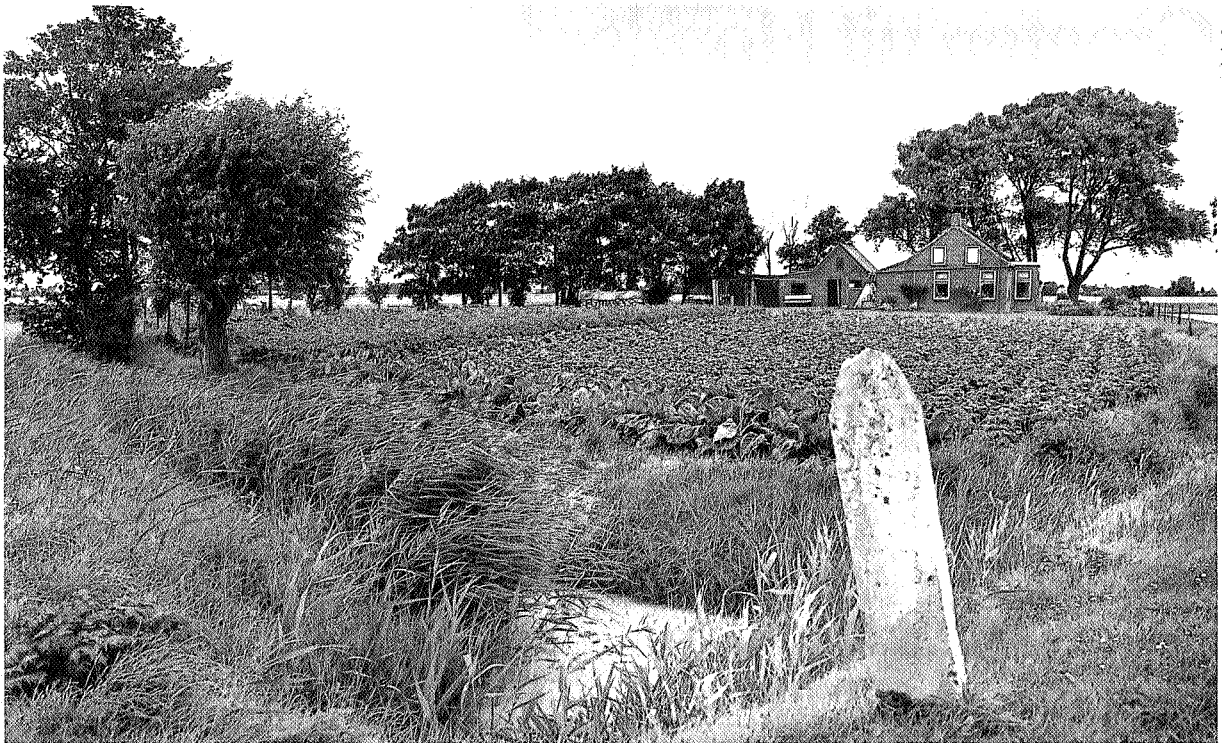
Rob de Groot