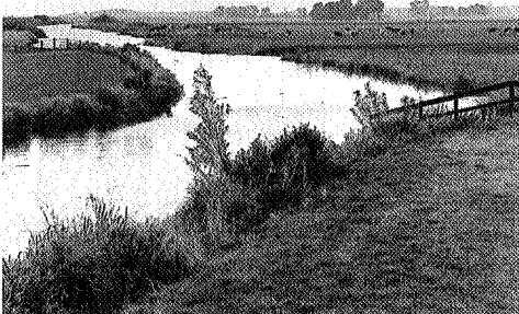
De Murk bij Giekerk