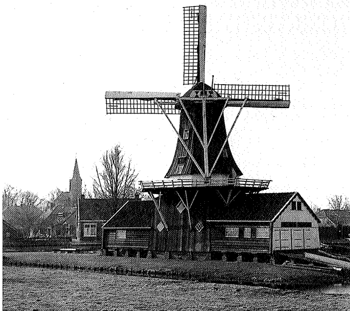
Houtzaagmolen de Fram in Woltersum

in 1863 aan de slopershamer ten prooi gevallen. Het enige wat in Wittewierum nog aan de Bloemhof herinnert is een naam van de boerderij aldaar.