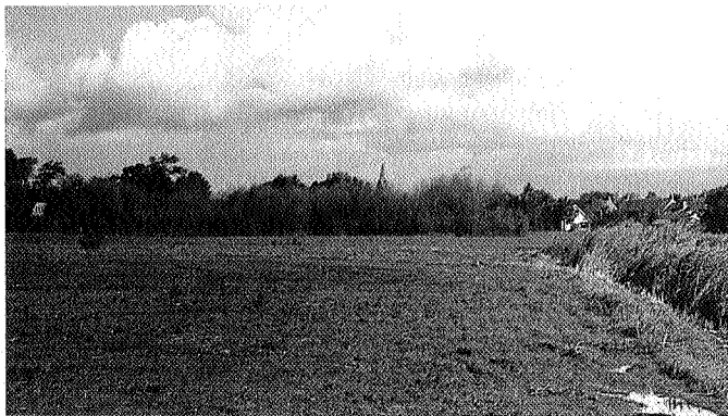
Het struweel op de voorgrond geeft de contouren aan van het restant van de dobbe bij Beetgumermolen