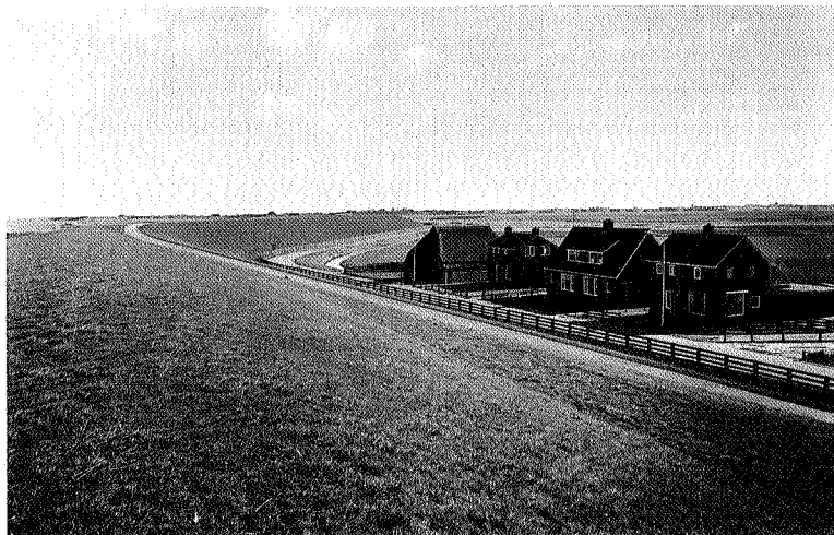
Friese waddendijk nabij Moddergat

aan zij te hoop tegen Gedeputeerde Staten. Op een hoorzitting varieerden de uitroepen van 'ik ha der nachtmerjes fan' en een 'radicale verandering van het waddenlandschap' tot 'blijvend ietsel met onevenredig grote gevolgen voor de inwoners van de dorpen'. Enigszins cynisch in dit geheel is het dat juist de gemeenten waaraan in het streekplan 'Windstreek' windturbines worden toebe-deeld, daar geen enkel belang bij hebben (Franekeradeel, Dongeradeel), terwijl de gemeenten wier gebied wordt uitgesloten juist graag windmolens willen (Het Bildt, Ferwerderadeel).