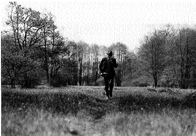
Hindrik Lanjouw, de eerste boer die de overstap deed naar de natuurbescherming