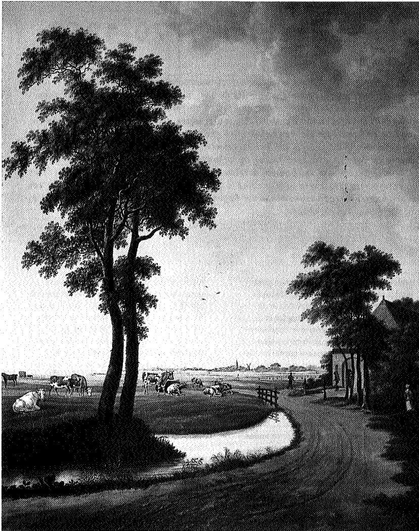
Schilderij van grasland met boerderij in de omgeving van Maarhuizen, door Jan Hendriks Aikens 1830. Schoorsteenstuk: eigenaar familie van Wijk te Winsum.

wat kleinere gebouwen werden door pachtboeren meestal in of vlakbij de dorpen neergezet.