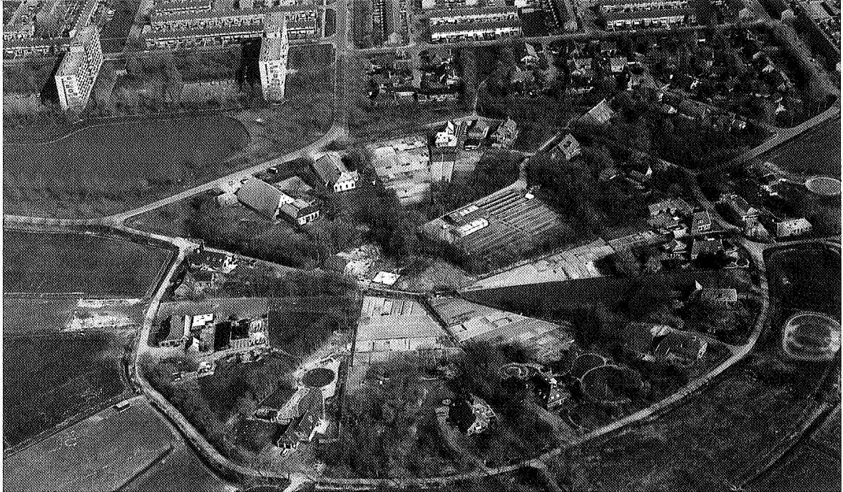
De flats van Delfzijl zijn gebouwd tegen de radiaire structuur van Biessum, foto Aerophoto Eelde.