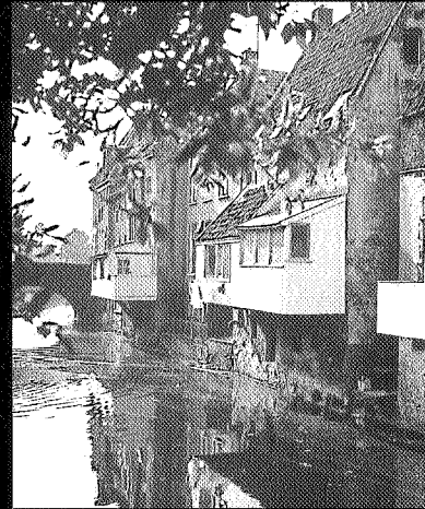
De hangende keukens in Appingedam, foto John Stoel.

te maken. In dit gebied is de baksteenindustrie dan ook heel belangrijk geweest. De knipklei als materiaal en het Damsterdiep en de vele maren als transportweg vormden de voorwaarden voor de concentratie van steenbakkerijen. Veen diende als brandstof voor de ovens. De eerste bakstenen in Groningen werden gebakken aan het einde van de 12e eeuw. Zo is de kerk van Aduard gebouwd van ter plaatse gebakken steen. Worden de eerste jaren de bakstenen nog gebruikt voor de bouw van kerken, later worden ook burgerlijke, adellijke huizen gebouwd van dit nieuwe bouw materiaal. In 1338 zijn er al zes steenhuizen in de stad Groningen te vinden. Ook in de Ommelanden werden bakstenen alras toegepast. Voor de 14e en 15e eeuw is berekend dat er minstens 700 steenhuizen in Stad en Ommelanden te vinden waren. Voor de periode van 1250 tot 1500 wordt de totale produktie van de provincie geschat op 50 miljoen stenen. In dit gebied hebben 35 steenfabrieken gestaan. Langs het Damsterdiep alleen stonden al 15 steenfabrieken. De baksteenindustrie is nu echter bijna verdwenen, en veel fabrieken zijn afgebroken; de rest wacht de slopershamer.