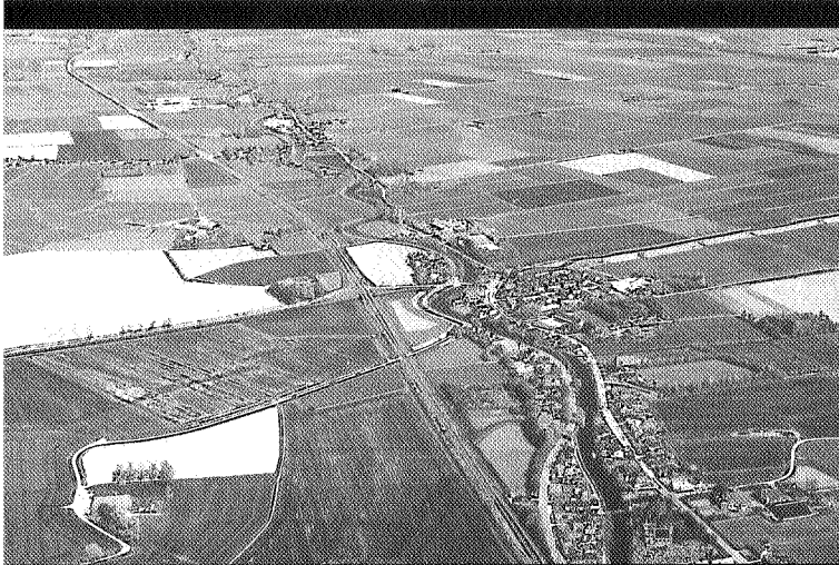
Het Damsterdiep meandert als een rivier, foto Aerophoto Eelde.