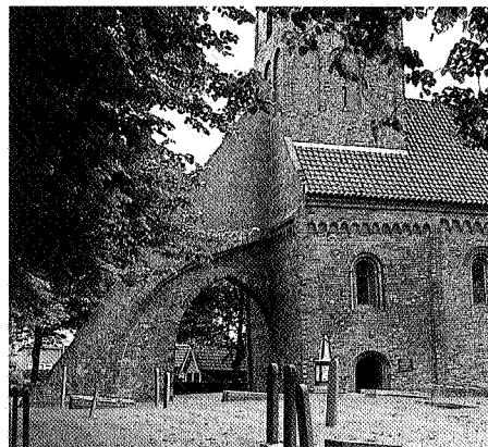
De steunbeer van de kerk van Bierum.

In het begin van deze eeuw is een gedeelte van de wierde afgegraven. In het dorp is een aantal panden het waard bekeken te worden: de Romaanse kerk, het oude Regthuis, de pastorie en de oude middenstandshuizen. Niet alleen de afgraving heeft het dorpsbeeld aangetast, ook de uitbreiding van het dorp naar het zuiden toe vertroebelt het beeld van een besloten wierdedorp. Langs de Wirdumermaar richting Wirdumerdraai (aan het Damsterdiep) liggen de huizen in een lint langs het water waardoor het beeld