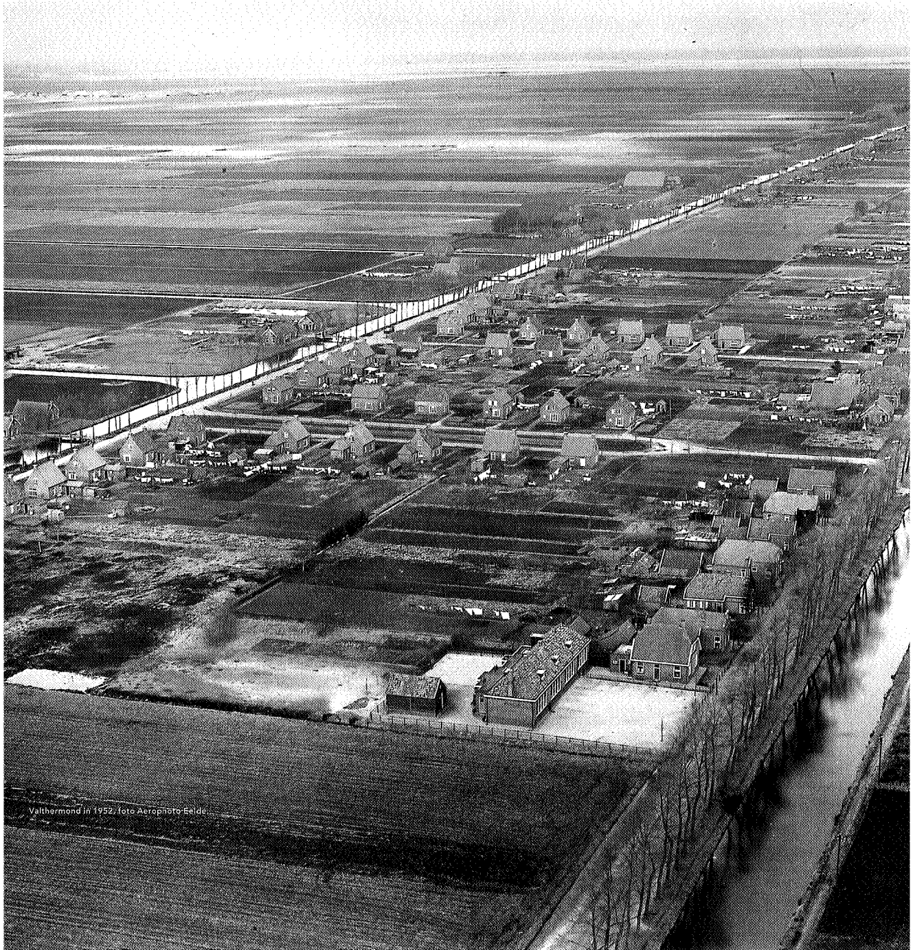
Valthmond in 1952