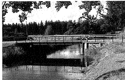
Het oostelijk deel van het Zuiderdiep is in oude luister hersteld, dammen zijn vervangen door bruggen, foto Harry Berg.

ge sluisje gerestaureerd. De historische en karakteristieke indeling van de voortuinen, die het gevolg was van één toegang over het water per twee boerderijen, is bij het opstellen van de plannen voor de erven zo veel mogelijk intact gelaten en zo mogelijk hersteld.