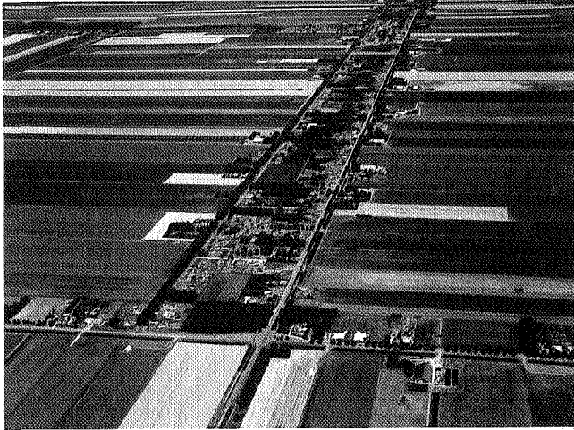
Valthernmond in 1995, foto Aerophoto Eelde.