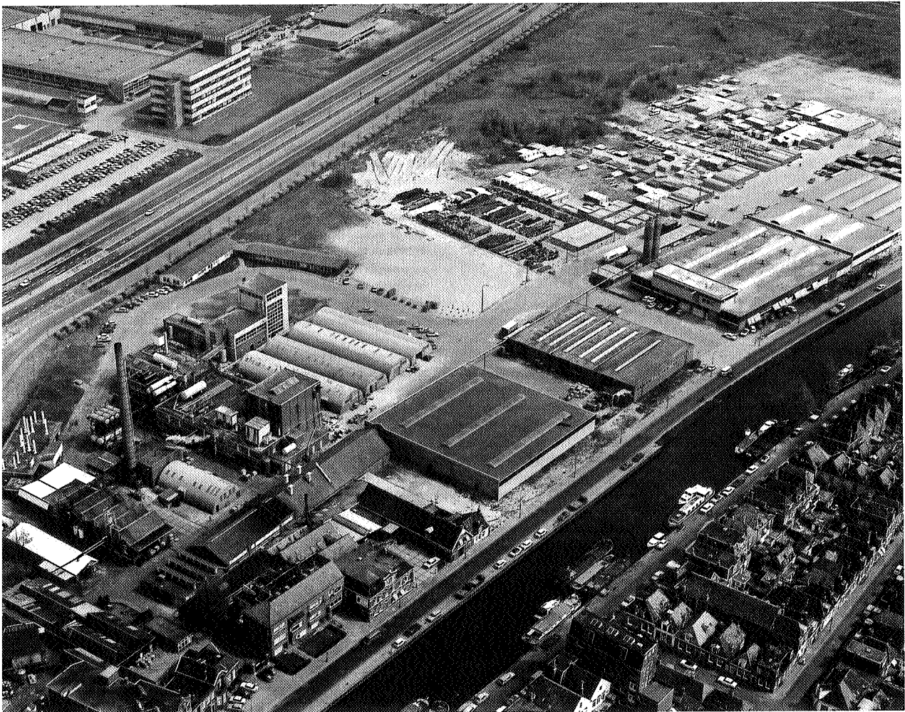
Het AAgrunol-complex aan het Winschoterdiep te Groningen (1971)