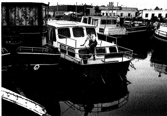
Woonboten in het Winschoterdiep