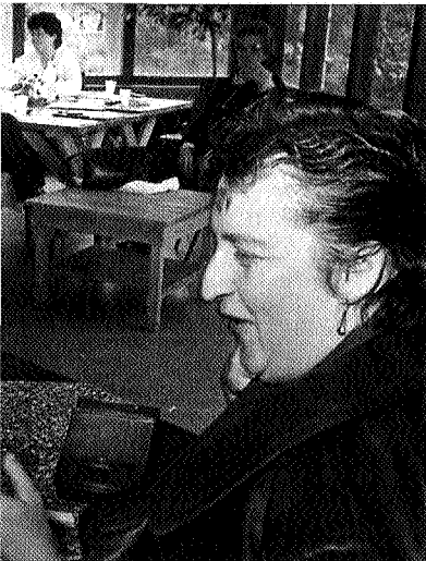
Oosterpoortbewoners vergaderen over AAgrunol