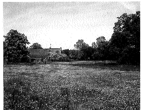
Bloemrijke graslanden, foto Hans Dekker

Er zijn binnen het visiegebied van de Drentse Aa drie gebiedscategorieën te onderscheiden: bovenlopen-, middenlopen- en benedenlopingebieden. De bovenlopingebieden kenmerken zich door een relatief sterke functiescheiding; zowel landbouw als bos en natuur zijn van elkaar gescheiden in grote gebieden. Er is relatief weinig bebouwing en de landbouw is grootschalig, net als de bossen. Het streefbeeld is gericht op het behouden en ontwikkelen van grote natuurgebieden en bossen die extensief benut worden voor houtoogst en natuurgerichte vormen van recreatie; bebouwing van landbouwgronden kan hieraan ook bijdragen. In de bovenlopingebieden liggen ook drie kansrijke loca-