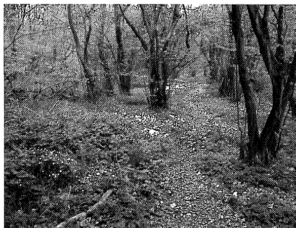
Moerasbos langs Anloërdiepje

Omdat bij het ontwikkelen van de gebiedsvisie Drentse Aa gelijk opgetrokken werd met de planvorming voor het ROM/WCL-gebied, konden sommige voorstellen al direct uitgevoerd wor-