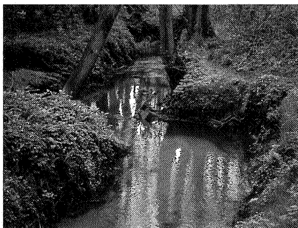
Voorjaar in het Gasterse Holt

hooilanden. De aanwezige houtwallen worden beschermd of waar nodig gerestaureerd of gereconstrueerd. De landbouwbedrijvigheid is naar verhouding kleinschalig. Het gebied heeft een oude cultuurgeschiedenis die teruggaat tot in de prehistorie. De hoge natuurwaarden van het gebied hangen ook samen met de lange geschiedenis van het menselijk ingrijpen. Deze bijzondere landschaps- en natuurwaarden blijven in het streefbeeld zoveel mogelijk behouden. Zij vormen het uitgangspunt voor de te kiezen beheersvormen. In sommige delen zal het beheer grootschaliger en extensiever worden. Het type landschap laat zich karakteriseren als half-natuurlijk. Het benedenlopergebied wordt doorsneden door het Noord-Willemskanaal en de rijksweg A28. Op de flanken van het beekdal zijn aan weerskanten landhuizen en landgoederen gelegen. In het streef-