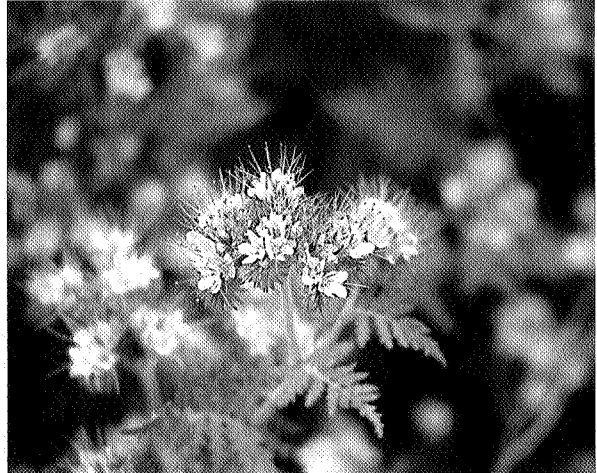
Bloem van de facelia