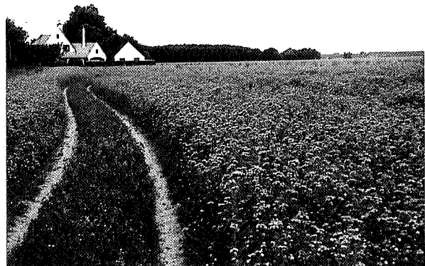
Facelia in bloei