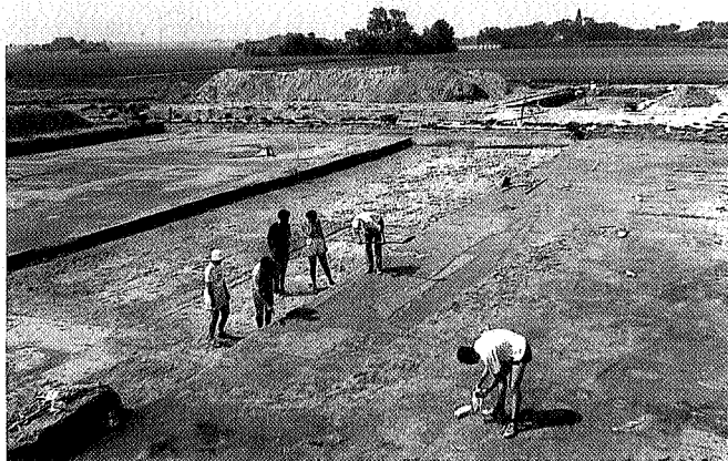
Opgraving te Wijnaldum

Zelfs bij grote, meerjarige opgravingen komt het voor dat één enkele vondst alles op zijn plaats doet vallen. Zo was het ook bij het onderzoek op een van de terpen van Wijnaldum (gemeente Harlingen). Miljoenen vondsten, maar natuurlijk zat in een van de laatste zakjes een stukje metaal dat na schoongemaakt te zijn, dé sleutelvondst van deze opgraving bleek te zijn, en dus meteen de landelijke pers haalde.