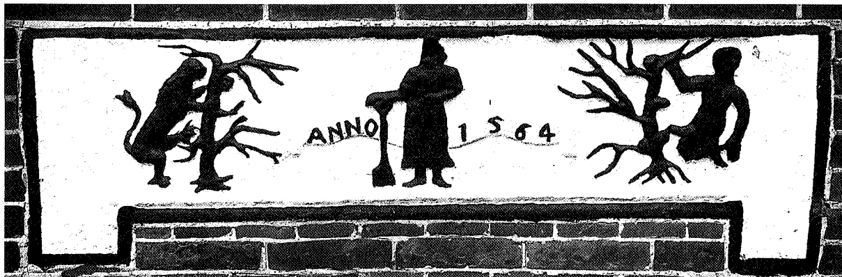
Afbeelding van Walfridus met spade en wilde dieren op de gevelsteen van de pastorie bij de Walfriduskerk te Bedum

zuur veenwater. Deze overstromingen hadden tot gevolg dat de vruchtbare zavelgronden ten noorden van Groningen werden bedekt met een taai, zure klei. Oude cultuurgronden veranderden weer in woeste grond en woonplaatsen raakten overslibd. De natuurlijke kweldergraslanden waardoor de wierden waren omgeven, maakten plaats voor rietvelden en moerasbossen. In het huidige verkavelingspatroon zijn deze woeste gronden herkenbaar aan de regelmatige percelen temidden van de veel oudere, onregelmatige blokverkaveling. De riet- en zeggenmoerassen werden gevoed door de afstromende Drentse riviertjes zoals de Hunze, de Aa, het Eelderdiep en het Peizerdiep. Maar ook de zee had er, via de Hunzedelta, vrij toegang en bracht tijdenwerking in de vele kreken die de moerassen en vloedbossen doorsneden. Waar het zoete water de overhand had, ontstond door opslag van wilgen, essen en elzen een Biesbos-achtige wildernis, waarin reigerachtigen, bevers, elanden, oerrunderen, wolven en wellicht ook beren naar hartelust verkeerden.