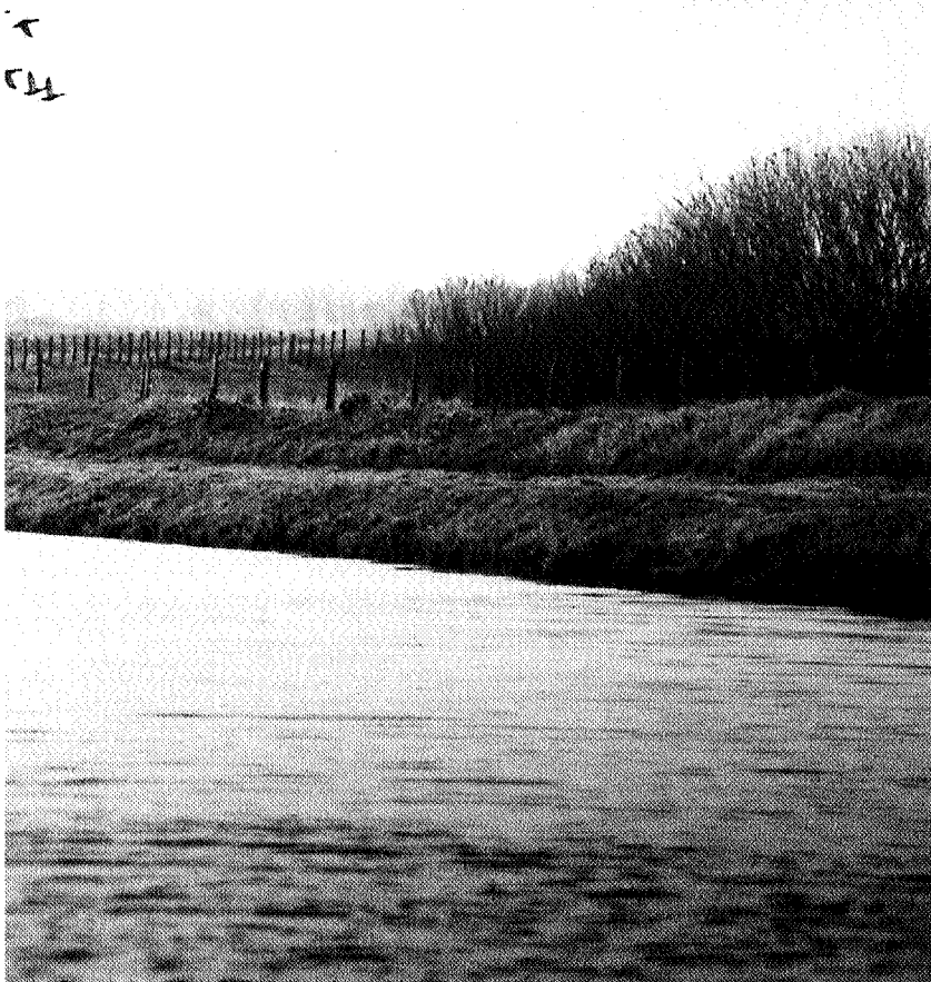
De huidige Hunze, foto Elmer Spaargaren

bool van de metamorfose van het woeste oerwoud vol wilde beesten in een vruchtbaar en vriendelijk korenland. Op afbeeldingen zien we hem steevast met een spade en enkele wilde dieren afgebeeld. Na zijn gewelddadige dood werd hij samen met zijn zoon Radfridus op het kerkhof in Adorp begraven. Veel rust zal hun gebeente niet vergund zijn geweest. Spoedig klonk in de jonge parochie Bedum de roep om zijn heiligen. De beenderen van Walfridus en zijn zoon werden opgegraven en in plechtige processie via de Munnikeweg naar de kerk