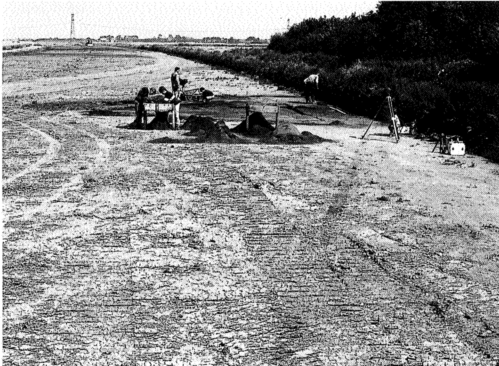
Tijdens de aanleg van de A7 in 1991, wordt bij Meedernertol een jachtkamp aangetroffen.

dateren van 8000 tot 6000 v. Chr., de middensteentijd. 'Dat was een fantastische ontdekking', vertelt Groenendijk. 'Het betekende dat zich in de Veenkoloniën geen resten uit andere periodes bevinden die het beeld van de middensteentijd kunnen vertroebelen. Hier kunnen wij dit tijdperk in haar meest zuivere vorm bestuderen en dat is erg bijzonder.'