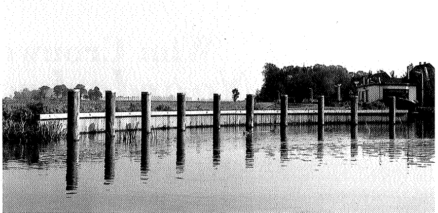
Ronde damwand in de Greuns

gemarkeerd en vormgegeven door drieboekige schermen van hout. De drieboeksvorm van die landmarks - zoals het project ook heet - verwijst naar de drieboekige constructie van de brug. Zij kregen een plek waar de cirkel het water en de weg snijdt. Het idee was om een territorium af te bakenen, zodat je om die twee dorpen een denkbeeldige cirkel zou kunnen trekken. Tijdens de gesprekken vooraf was namelijk gebleken dat de dorpen min of meer het kunstwerk wilden gebruiken om een vuist te maken tegen de gemeente Leeuwarden. Zij voelden zich bedreigd in hun bestaan, doordat de stad steeds verder oprukt en ze willen hun landschappelijkheid bewaren. Deze cirkel, de buitenste, symboliseert een soort grens. In de trant van: 'dit is van ons', zo omschrijft Hamersma zijn concept. Omdat hij ook de verbondenheid tussen de twee dorpen wilde aangeven trok hij een tweede cirkel heel kort rond de brug. 'Die twee dorpjes hebben ieder dan wel hun eigen naam, maar ze zijn tegelijkertijd ook één. Die binnencirkel is het symbool van die samenhang', aldus Hamersma, die vooral met de binnencirkel aardig in de problemen raakte.