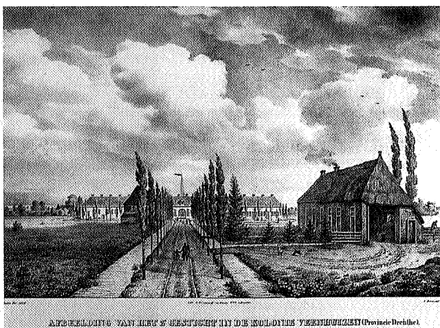
Het tweede gesticht te Veenhuizen in 1826

Veenhuizen ligt ingeklemd tussen twee belangrijke natuurgebieden. Ten noorden van Veenhuizen ligt het reservaat de Tempelstukken, een beekdalreservaat dat in de Herinrichting Roden/Norg verder gestalte zal krijgen. Ten zuiden van Veenhuizen ligt het hoogveenreservaat Fochteloërveen, één van de belangrijkste hoogveengebieden van Nederland. Veenhuizen ligt als cultuurlandschap tussen deze twee ecologisch belangwekkende reservaten waar