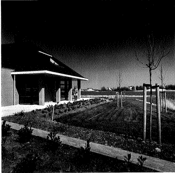
Zo worden veel huizen gebouwd in Friese dorpen

omgeving'. De provincie onderstreept nog eens dat het van belang is wanneer dorpen zich bewust zijn van de dorpskarakteristieken: 'Dan zijn zij als belanghebbenden waardevolle gesprekspartners voor plannemakers. Gemeenten zijn en blijven echter de eerstverantwoordelijken voor de ruimtelijke kwaliteit' .