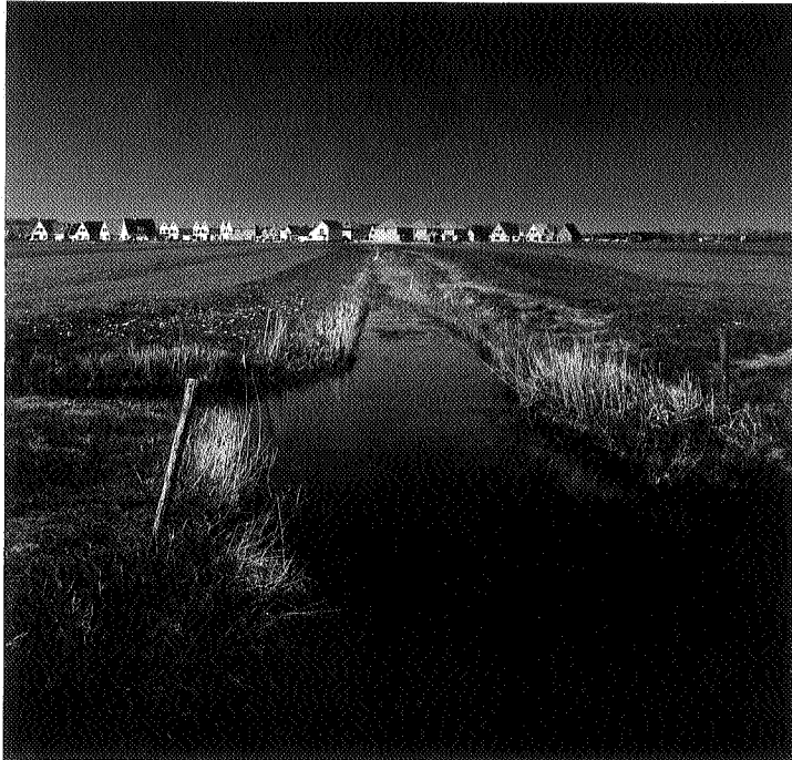
In Friesland komt veel witte schimmel voor, zoals hier bij Damwoude. Architectuur Lokaal geeft adviezen om tot verantwoorde stedenbouwkundige uitleg en architectuur te komen

ieningenniveau op peil houden. De gemeente probeert het oprukken van de 'witte schimmel' bij de uitbreidingen onder controle te houden door een strak welstandsbezoek. De ergernis over deze vrije sectorbouw in witte betonsteen of - de laatste tijd steeds vaker - in de vorm van semi-landelijke bungalows van rode baksteen en met rode dakoverstek die overal in Nederland uit de grond schiet, wordt steeds vaker geuit. In het januarinummer van loorderbreedte bijvoorbeeld, werd de gemeente Winsum algemeen fel bekritiseerd, en in meer algemene zin zei landschapsarchitect Dirk Sijmons over dergelijke woningbouw: 'Deze woningen komen meestal uit een catalogus. Het is alsof ze door een vliegtuig zijn afgeworpen. Een alarmerende ontwikkeling'. De Omrop Fryslân besteedde twee items van haar zendtijd op de landelijke televisie aan 'verschimmeling' van de