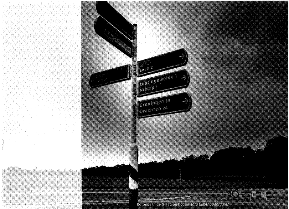
Rotonde in de N 372 bij Roden

Blauwgrasland is zonder twijfel het vegetatietype dat in Nederland de meest dramatische achteruitgang te zien heeft gegeven: de achteruitgang van de kenmerkende soorten en van het vegetatietype als geheel is onder biologen spreekwoordelijk. Behalve een grote kwetsbaarheid voor verrijking, bleek het vegetatietype ook extreem gevoelig voor ontwatering. Relatief geringe dalingen van de waterstand kunnen al grote gevolgen hebben: doordat kalkrijk opwellend grondwater wordt afgevangen, kan al snel verzuring inzetten.