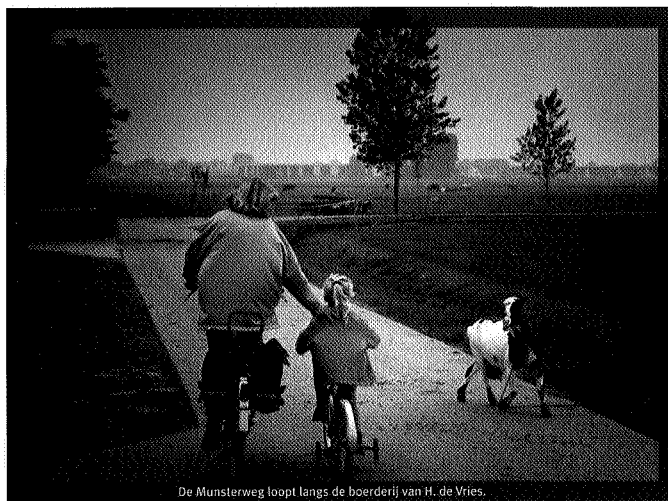
De Munsterweg loopt langs de boerderij van H. de Vries.