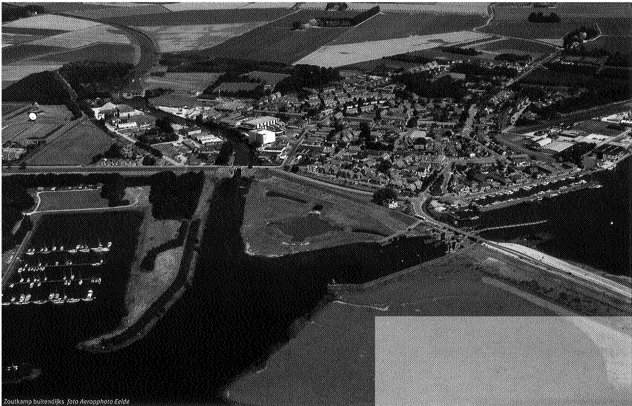
Zoutkamp buitendijs

De structuurvisie bevat nog vele andere plannen en ideeën: een afmeer-gelegenheid voor de Bruine Vloot, het restaureren van de historische sluizen en het opknappen van de Reitdiepskaden. Het zijn nog maar plannen. De structuurvisie is nog niet door de gemeentelijke politiek vastgesteld. Ook na goedkeuring door de gemeenteraad staat niet alles vast. Een markttoets zal moeten aanwijzen welke projecten interessant zijn voor uitvoering en realisering. 'Je moet de plannen zien als een langspeelplaat' , besluit Van der Vegt. 'We komen steeds dichterbij het gaatje. Uiteindelijk gaat Zoutkamp weer een echt mooi dorp worden.'