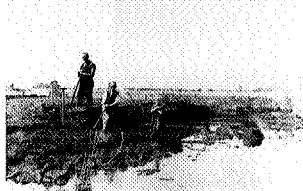
Turfwinning vóór de ontginning