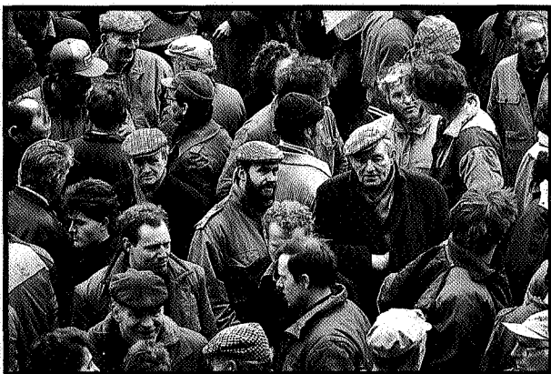
▲ Is er voor boeren nog plaats in het landschap?

Volgens Elerie zijn de resultaten van onderzoek niet rechtstreeks te vertalen in beleid. Onderzoek kan alleen keuzes ondersteunen. Dat kan ondermeer het geval zijn bij het opnieuw introduceren van eerder verdwenen landschapselementen. Als voorbeeld noemde Elerie de aanplant van bos op een locatie waar volgens bronnen vroeger ook bos had gestaan. Bij aanvullend bodemonderzoek bleek daar nog bosgrond aanwezig te zijn. De erkenning van de nauwe relatie tussen ecologische en morfologische landschapsontwikkeling is echter op zichzelf al belangrijk. Want in tegenstelling tot het verleden zal in de toekomst bij de ontwikkeling van het landschap de speelruimte voor natuurlijke processen een onderwerp van de planvorming zijn.