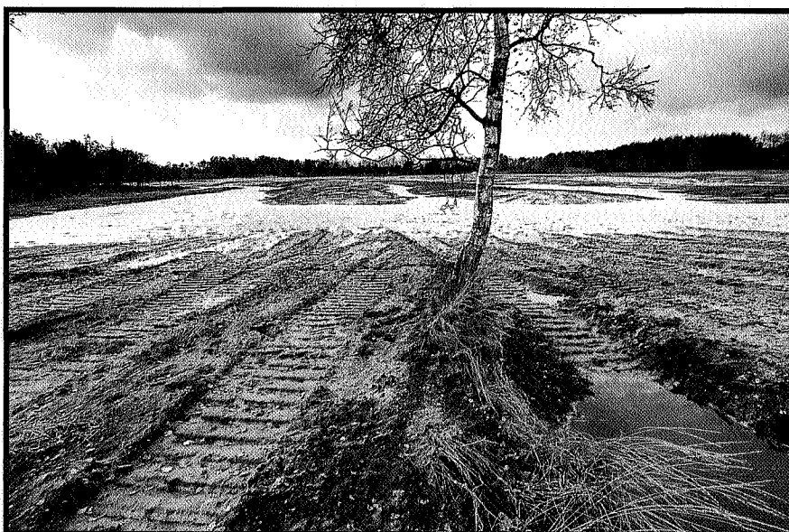
▲ Natuurontwikkeling op landgoed de Vossenbergh

'Wat is natuurontwikkeling? Projecten worden meer en meer met een enorme PR bij het publiek geïntroduceerd. Neem Plan Goudplevier: er is daar sprake van een grote schaal en de bouwvoor wordt helemaal afgevoerd. Maar als je kijkt naar de doelstellingen, de beheersvorm en het uiteindelijke landschap dat gaat ontstaan, is het in wezen hetzelfde wat de natuurbescherming al veertig jaar doet. Wat ik wel natuurontwikkeling zou willen noemen, is de ontwikkeling van processen in systemen. Neem een Drents beekdal, gooi alle sloten dicht en dan maar zien waar het water uittreedt en wat er zonder ingrepen van de mens allemaal gebeurt.'