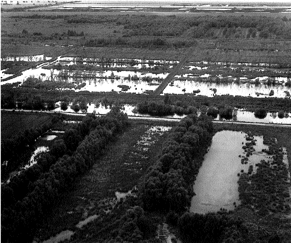
▲ Hoogveenreservaat Bargerveen in Z.O. Drenthe