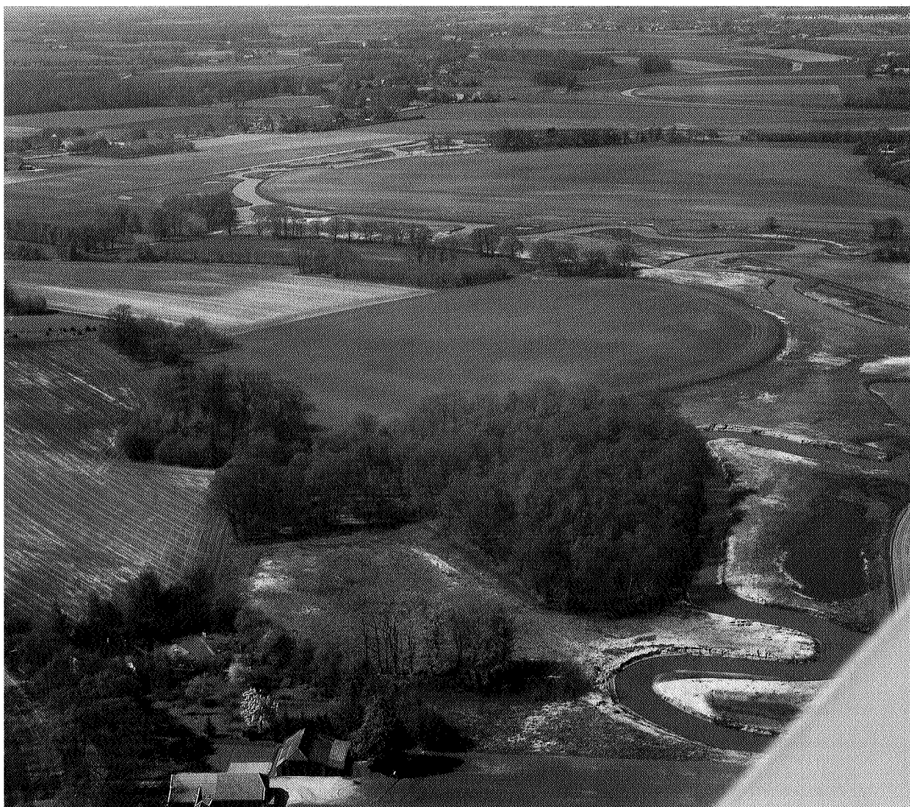
▲ Beekdal Ruiten Aa bij Sellingen