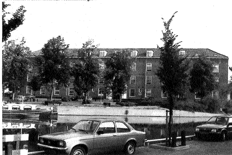
In de kazerne te Leeuwarden zijn wooneenheden gebouwd.

Bescherming verandert van richting, van behoud door conservering naar behoud door verandering. Een nieuwe strategie, waarin de aparte positie van de monumentenzorg wordt ingeruild voor een geïntegreerde plek in de zorg voor de gebouwde omgeving. Bescherming van monumenten: een bijzondere vorm van veranderen en aanpassen van onze omgeving aan wat wij er nu van eisen.