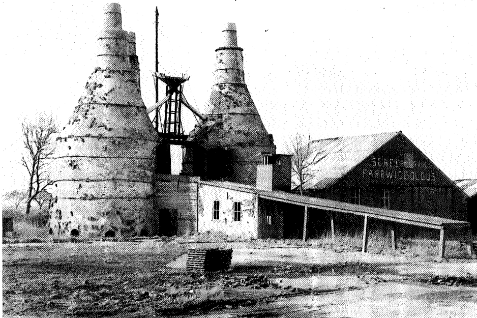
Kalkovens tussen Garmerwolde en Ten Boer