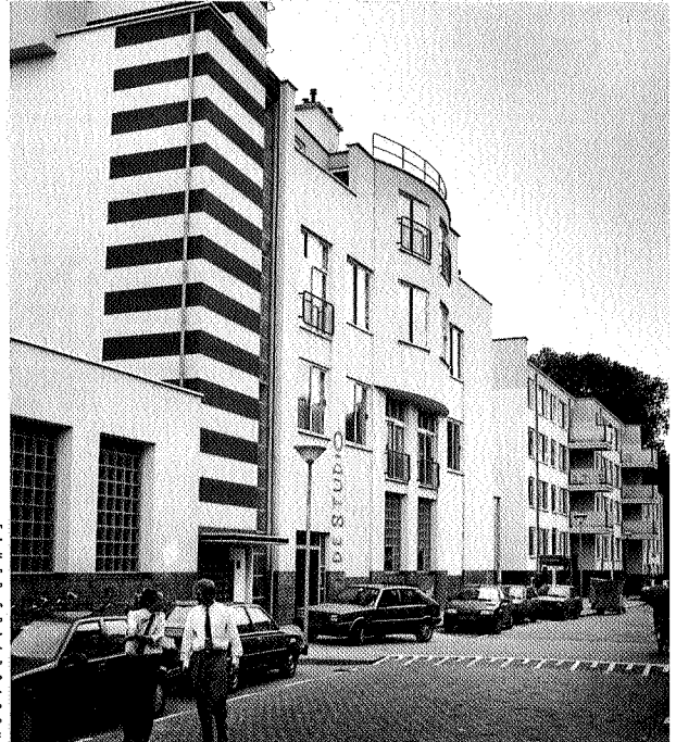
Moesstraat tegenwoordig, gefotografeerd van de andere kant

Geen deel van de woningvoorraad is zo uitzonderlijk samengesteld als juist onze monumenten. Naast woningen in alle maten en soorten hebben voormalige boerderijen, kerken, raadhuisen, beurzen, politieposten, kazernes, watertorens, fabriekspannen, stations, molens en kalkovens er een plaatsje in veroverd. Bijna alles blijkt omgevormd te kunnen worden tot ruimte om te wonen. Soms vrij eenvoudig, soms alleen door ingrijpende veranderingen, meestal niet zonder een hoge inzet: gedrevenheid, uithoudingsvermogen en geld. Wonen in een monument is voor weinigen een straf, voor velen een ideaal.