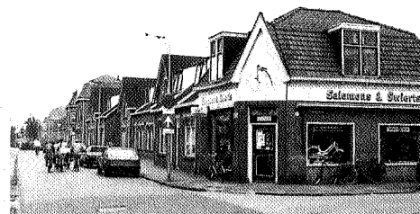
Afb. 2 Sociale woningbouw in combinatie met voorzieningen te Hogeveen. Ontwerp van gemeentearchitect J. Carmiggelt

opgevat als het werken, het rekreëren, het zich verplaatsen en het daadwerkelijk in een huis wonen. Alle elementen die op één of andere manier daarbij horen, zijn eveneens onderwerp van studie. Kort gezegd, het MIP doet onderzoek naar alle ons omringende bebouwingselementen uit de periode 1850-1940. Gezien de aanwezige bouwvoorraad lijkt het een immense opdracht. Het is dan ook noodzakelijk om op systematische en enigszins selectieve manier te werk te gaan. De eerste stap betreft het opsplitsen van de provincie in een aantal samenhangende delen. In Drente zijn dat de regio's Zuidwest-Drente, het Drents Plateau en Oost-Drente. Vervolgens is per