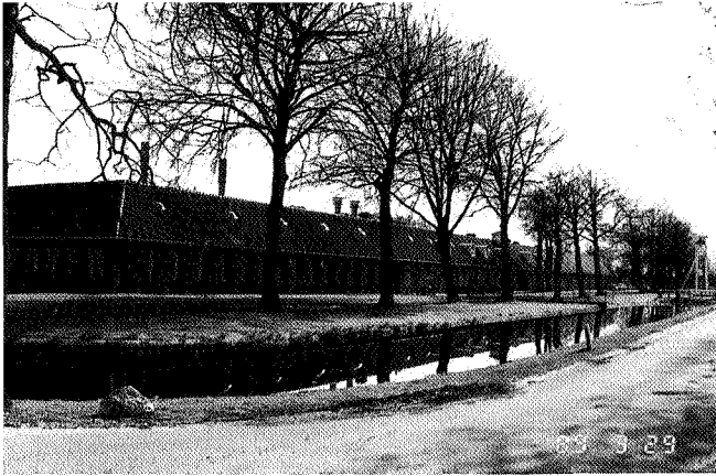
Afb. 5 Het carrévormige gestichtsgebouw te Veenhuizen. Inmiddels is het verbouwd in een gedeelte met woningen en een gedeelte met werkplaatsen