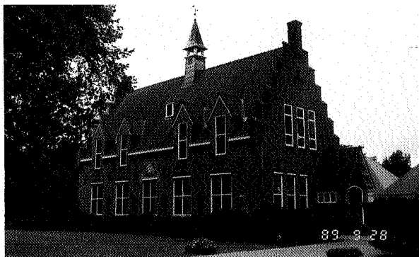
Afb. 3 Het Gemeentehuis van Sleen (ontwerp van A. Baart, als karakteristiek element in het verdichtingspatroon rond de brink

voorbeeld de aanwezigheid van schutsluizen, zoals hier de sluis tussen de Norgervaart en de Kolonievaart. Het zijn de stille getuigen van een boeiende civieltechnische geschiedenis. De Drentse waterstaatkundigen moesten zorgen voor voldoende water in het veengebied om het uitdrogen van de gronden te voorkomen maar tegelijk moest de scheepvaart gegarandeerd blijven. Twee soms tegenstrijdige thema's waarvoor schutsluizen een goede oplossing boden. Nu worden ze niet meer als zodanig gebruikt, hen resteert niet veel anders dan een eventuele sportvisser te verleiden om plaats te gaan nemen.