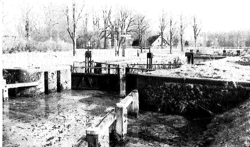
Afb. 1 Karakteristiek in het kultuurlandschap zijn de schutsluizen

Het MIP richt zich op het wonen in de breedste zin van het woord. Dat betekent dat wonen wordt