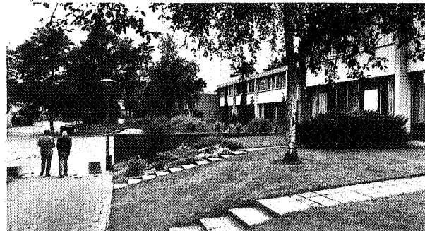
De wijk Emmerhout

Voor 1950 was Emmen een esdorp, gelegen op de Hondsrug. De gemeente, met een oppervlakte van 28.000 ha, is daarmee de op 4 na grootste van Nederland en omvat naast Emmen nog 9 dorpen die voor het merendeel in de Veenkoloniën liggen. De gemeente telt nu zo'n 93.000 inwoners, waarvan Emmen er 53.000 huisvest. De verandering van Emmen van boerendorp naar industriële plaats had als oorzaak het grote aantal ongeschoolde werklozen in de veengebieden. Om deze werkloosheid te bestrijden vestigde de AKU zich in Emmer Compascuum en later de ENKA zich in Emmen. André de Jong: 'Om enig inzicht te krijgen in de wensen en verlangens van deze veenarbeiders hebben wij zeer veel gepraat met huisartsen, dominees, de