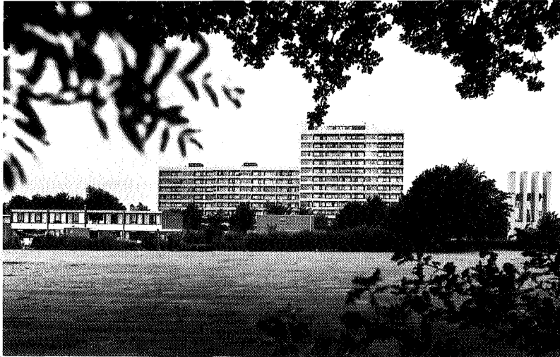
Hoogbouw in Angelslo