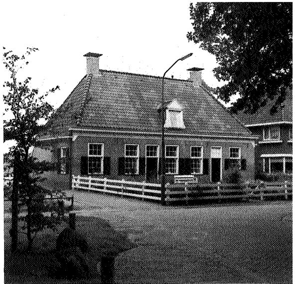
Gerestaureerd woonhuis aan de Brink in Dwingeloo

vooraf niet bekend. Toch vertellen de architecten dat ze ook daar het hele proces moeten doorlopen, maar nu met mensen van de gemeente en de nutsbedrijven. 'Die moeten ook creatief door de bocht. Hun rioleringspatroon en allerlei leidingen moeten aan ons plan aangepast worden. Om ze zover te krijgen is vaak flink wat doorzettingsvermogen nodig. De dag na het opleveren is een woningbouwproject op z'n maaist als vormgeving. Een week later gaan de gebruikers schuttingen, koniferen en schommels plaatsen en in het ergste geval lelijke gordijntjes ophangen. En na 2 jaar vinden ze opeens dat de architect toch niet de goede kleur voor het huis gekozen had en gaan ze opnieuw schilderen. De dag na het opleveren moet je het als architect uit je hoofd zetten. Als je