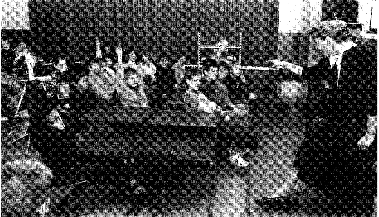
Scholen in Oost-Groningen krijgen voorlichting over energiebesparing