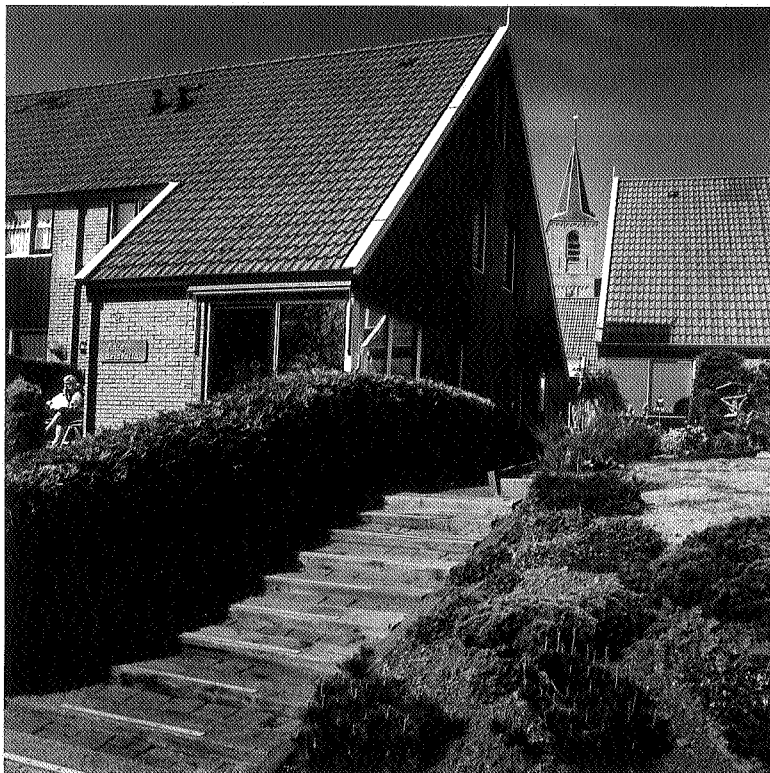
Dorpsuitbreidingen kunnen ook in samenhang met de structuur van het dorp en het landschap gebeuren op een manier zoals architect Gunnar Daan dat enkele jaren geleden realiseerde in Anjum

Architectuur Lokaal Kwartaalkrant, sinds juni 1993. Jaarabonnement f 40,00, gratis voor gemeentebestuurders.